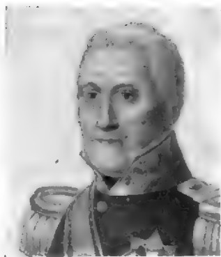
14. C. R. TH. KRAYENHOFF (1758—1840)